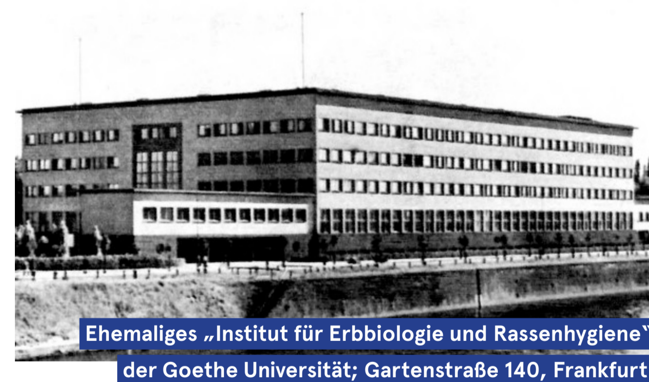
Ehemaliges „Institut für Erbbiologie und Rassenhygiene“ der Goethe Universität, Gartenstraße 140, Frankfurt

Josef Mengele wurde 1911 geboren und gehörte zu einer Familie, die eine bekannte Landmaschinenfabrik besaß. Er studierte Medizin und Naturwissenschaften in München, Wien und Bonn. Anschließend promovierte er in München in Anthropologie zur „Rassenmorphologischen Untersuchung des vorderen Unterkieferabschnittes bei vier rassischen Gruppen“ und orientierte sich an der Ideologie der „Rassenlehre“. Mengele trat 1931 dem deutschnationalen „Jung-Stahlhelm“, einer schlagenden Verbindung, bei. 1937 assistierte Mengele an der Goethe-Universität Prof. Otmav von Verschuer, Leiter des „Instituts für Erbbiologie und Rassenhygiene“ und promovierte 1938 an der Goethe-Universität in Medizin zum Thema „Stippenuntersuchungen bei Lippen-Kiefer-Gaumenspalte“. Er trat der NSDAP (1937), der SS (1938) und der Waffen-SS (1940) bei.