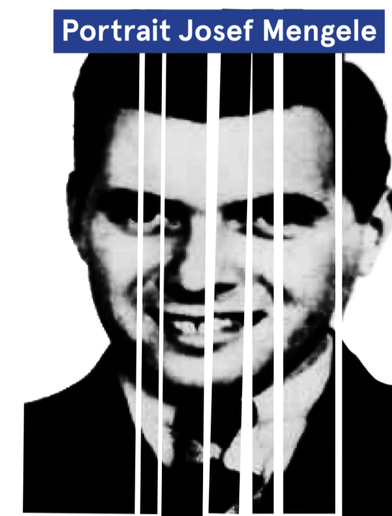
Portrait Josef Mengele