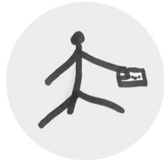
Abb. 4: Konsumausweis