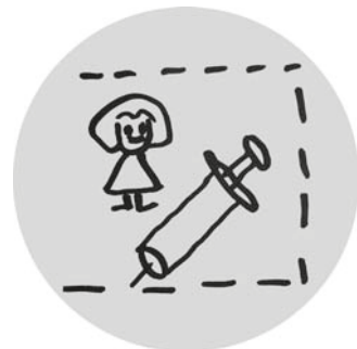
Abb 5a: Konsumräume