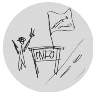
Abb. 2: Junkies gehen auf Bürger_innen zu