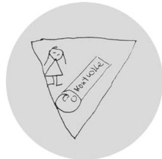
Abb. 5: Maßnahmen für Frauen;