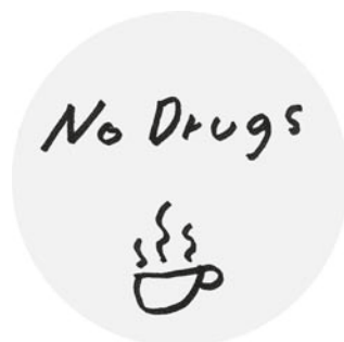
Abb. 1: (Autonomer) Substituiertentreff

„Junkies gehen auf Bürger_innen zu“: Die Einrichtung einer Selbsthilfe- und Aufklärungskampagne „Junkies gehen auf die Bürger_innen zu“, würde nach Ansicht der männlichen Berliner Workshop-Teilnehmenden dazu beitragen, den vielfach erlebten Vorurteilen und Verunsicherungen von Bürger_innen im Umgang mit Drogengebrauchenden durch Aufklä-